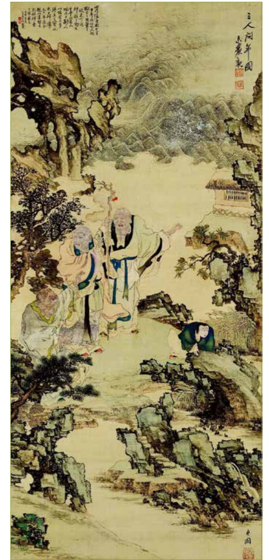
<삼인문년>, 장승업, 비단에 채색 152.0×69.0cm, 간송미술관

오원 장승업을 흔히 '조선 최후의 거장'라고 한다. <삼인문년>은 그를 왜 그렇게 부르는 지를 명확히 보여준다. 하지만 '거장'보다는 '최후'란 단어가 더 무겁게 다가온다. 이는 장승업을 깎아내리고자 함이 아니라, 그가 살다간 시대에 대한 아쉬움이 더 크기 때문이다. 역시 예술은 시대의 거울이다.