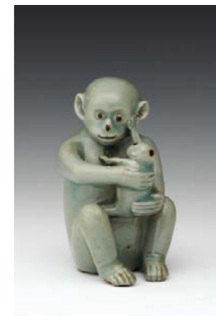
그림4: 청자원형연적(靑瓷猿形硯滴, 국보 제270-1)

간송이 우리 문화재를 지키려는 집념을 잘 보여준 일화가 있는데 1936년에 조선백자의 정수로 꼽히는 백자청화철채동채초충문병(白磁靑畫鐵彩銅彩草蟲文瓶, 국보 제294호, 그림3)을 경성미술구락부의 경매에서 일본인 골동 거상들과 치열한 경합 끝에 거금 1만4천580원에 낙찰을 받은 것이다. 당시 경성의 기와집 한 채 값이 1천 원 정도이니 간송의 집념과 비장한 큰 뜻을 잘 보여주는 일화이다. 1937년 동경에서 변호사로 오랫동안 살던 갯츠비(Sir John Gatsby)가 영국으로 돌아가게 되었다. 갯츠비는 30여 년간 주로 고려청자를 수집하였는데 그 양과 질에서 타의 추종을 불허하였다. 영국으로 돌아가기 전 이 귀중한 문화재를 처분하려 한다는 소문을 들은 간송은 동경으로 급히 가서 조선의 귀중한 문화재가 있을 곳은 조선이라고 끈질기게 설득하였다. 갯츠비도 조선의 훌륭한 문화재가 일본인들 손에서 좌우되는 것을 안타깝게 여기고 있던 차에 조선 청년의 집념을 보고는 국보급 고려청자 20점을 40만원(경성 기와집 400채 값)에 넘겨주게 되었다. 간송은 공주의 5천석지기 전답을 팔아 구입 자금을 마련하였는데 우리 문화재에 대한 열정과 집념은 놀라지 않을 수 없다. 갯츠비로 부터 사온 청자 중 국보로 지정된 것은 4점, 보물3점 등이 있다. (靑瓷猿形硯滴, 국보 제270-1, 그림4)