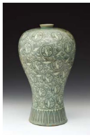
그림2: 청자상감운학문매병(靑磁象嵌雲鶴文梅瓶, 국보 제68-1)

간송은 선조로부터 물려받은 재산이 10만석 부자로 1930년대 조선팔도에서 제4위의 거부였다. 휘문고보를 거쳐 와세다 대학으로 유학을 갔는데 동경의 고서점에 수많은 귀중한 우리 문화재가 있는 것을 보고 충격을 받아 어마어마한 재산을 아낌없이 털어 일생 동안 우리 문화재를 지키는데 바쳤다. 이 분이 귀중한 우리 문화재를 수집하는 많은 일화가 있는데 당시 경성에 좋은 골동품이 나오면 일본인 수집가나 우리의 재력가들은 값을 깎으려 하였으나 간송은 깎기는 커녕 골동상들에게 그 가치를 모른다 하며 부른 값 보다 두 배나 세 배 더 많은 값으로 매입을 하는 경우가 많았다. 안동에서 발견된 훈민정음 해례본은 원래 1천원을 부르는 것을 그 가치에 맞지 않는다고 10배인 1만원을 주고 산 일화는 유명하다. 또 한국동란 때는 이 문화재들을 지키려 피나는 노력을 하였는데 간송은 다른 문화재는 포장을 하여 미군열차로 보냈지만 훈민정음만은 가슴에 꼭 품고 피난을 하였다. 간송의 우리 문화재를 지키려는 훌륭한 계획이 알려지면서 뜻있는 소장가나 골동상들은 1급의 물건은 모두 간송에게로 보내야 한다는 의로운 생각들을 하게 되었다. (그림2: 靑磁象嵌雲鶴文梅瓶, 국보 제68-1)